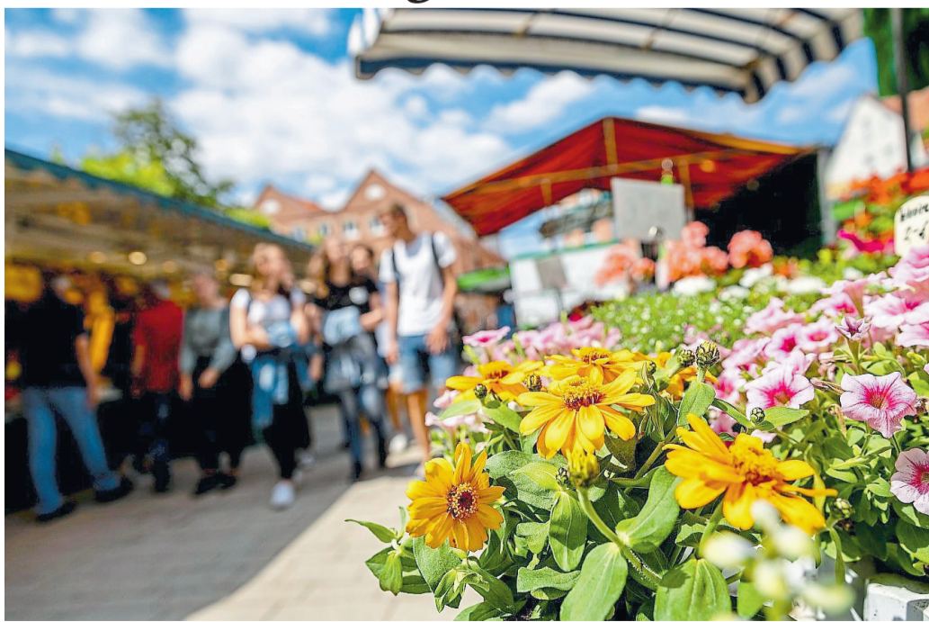
Die Bauernmarktsaison startet an diesem Samstag (2. April) wieder. Von 9 bis 15 Uhr werden auf dem Marktplatz Produkte aus der Region angeboten.

Aus der Region, für die Region: Das sei das einfache, aber überzeugende Prinzip des Bauernmarktes, der bereits seit vielen Jahren Besucher in die Steverstadt lockt, heißt es weiter. Ob Fleisch, Wurst, Eier, Gemüse, Kräuter, Brot oder Milchprodukte: Viele der angebotenen Produkte stammen aus der unmittelbaren Umgebung Lüdinghausens. Weitere Stände mit Dekoartikeln, Textilien und handwerklichen Erzeugnissen runden das umfangreiche Sortiment des Marktes ab. Gegen den kleinen Hunger gibt es Brat-